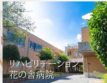
回復期リハ病棟114床